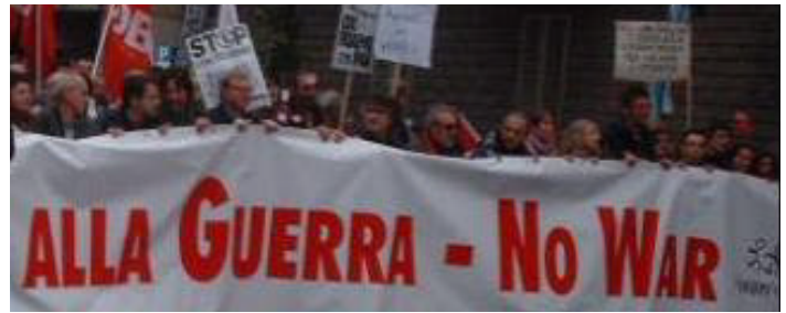
Un millón de personas marcharon en Florencia, Italia

Para completar, Juan José Ibarexte, líder del Partido Nacionalista Vasco (PNV) y gobernador de esta región, ha propuesto convertir a su país en un Estado Libre Asociado (oh no!!!, el legado de Muñoz Marín para el mundo) del gobierno español. Como era de esperarse, el PP y el PSOE se han opuesto alegando que para la convivencia los vascos deben dejar a un lado sus aspiraciones de mayor libertad, mucho menos de autodeterminación.