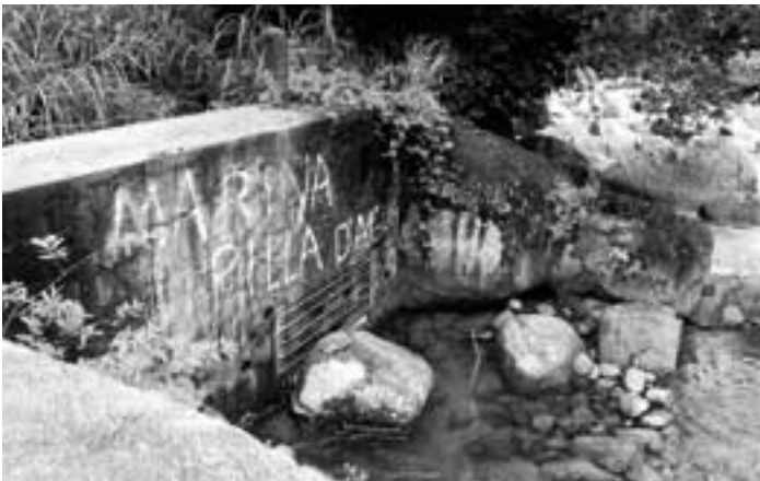
"Marina pilla de agua", en la toma de la Marina en el Río Blanco de Naguabo de donde roba millones de galones diarios

Dstrucción del ambiente y la salud, violación de derechos civiles, brutalidad y tortura, militarización, robo de agua y pena de muerte.