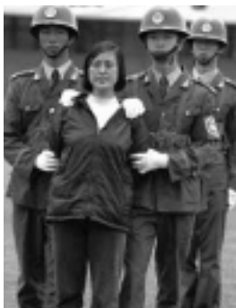
Prisionera china forzada a desfilar hacia su ejecución.

El Estado crea la pobreza para luego castigarla mediante los actos de mayor represión y brutalidad. Niegan que la criminalidad sea una consecuencia de la pobreza, la discriminación y la desigualdad. Un Imperio lo hace de igual manera pero a gran escala afectando a otras naciones mediante la