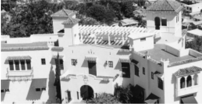
La fortuna Serrallés fue producto de la esclavitud y la explotación obrera.

Decenas de familias del barrio Coto Laurel de Ponce rescataron 16 cuerdas de terrenos para exigir que se les haga justicia. Los terrenos aparecen a nombre de la empresa Desarrollo e Inversiones del Sur (DIS) que no es otra cosa que un frente de la acaudalada familia Serrallés. DIS tiene planeado construir un centro comercial y un proyecto de vivienda privado de tipo walk ups en los terrenos disputados. Según los rescatadores, la familia Serrallés usurpó terrenos designados para vivienda pública (pertenecientes a la extinta Corporación de Renovación Urbana y Vivienda, CRUV) cuando la carretera PR-506 fue cambiada de curso en la década del setenta.